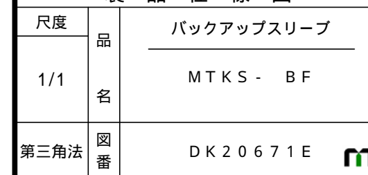
製 品 仕 様 図